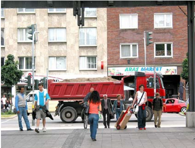
Unterwegs in Hagen, Juni 2005