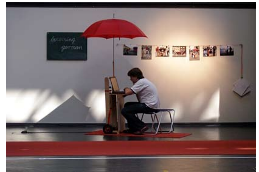
Die festinstallierte Info-Stelle bei der Ausstellung “Kunst Computer Werke”.