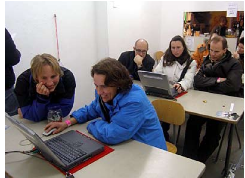
Die festinstallierte Info-Stelle bei Oberwelt e.V, Stuttgart