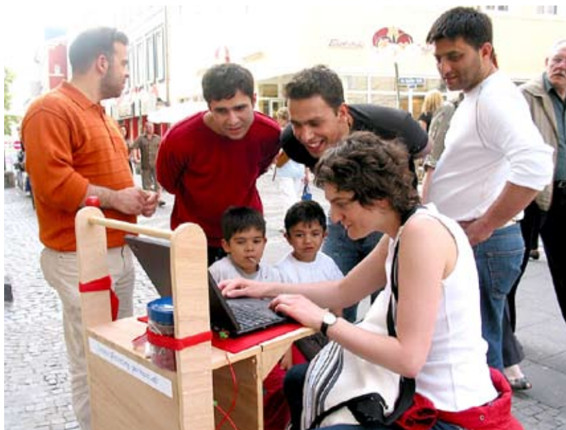
Unterwegs in der Iserlohner Innenstadt, Juni 2005

Seit November 2004 war ich mit der Internet-Datenbank "becoming german" dem speziell angefertigten Mobil-Info-Modul quer durch Deutschland auf Wanderschaft. Die Wanderschaft vor Ort ermöglicht persönliche Kontakt beim Sammeln von Informationen und einen direkten Austausch zwischen Erzähler und Zuhörer im Sinne der mündlichen Überlieferung.