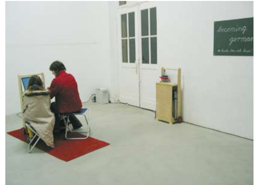
Die festinstallierte Info-Stelle im Kasseler Kulturbahnhof, November 2004