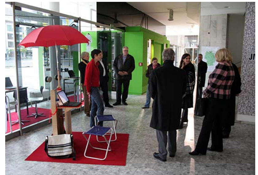
Die festinstallierte Info-Stelle bei in der Kunstforum Ostdeutsche Galerie