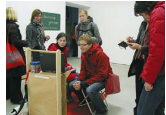
Bei der Eröffnung im Kasseler Kulturbahnhof, November 2004

Zu festgelegten Zeiten bin ich anwesend, um das Projekt zu betreuen.