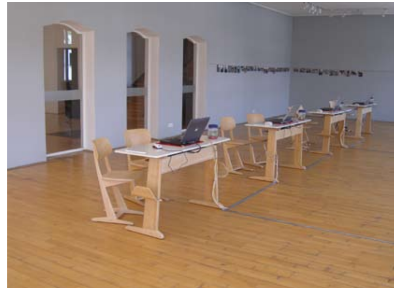
Die festinstallierte Info-Stelle in der Städtischen Galerie Iserlohn