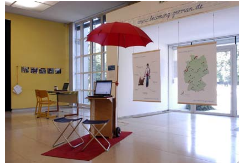
Die festinstallierte Info-Stelle beim Kunstforum Ostdeutsche Galerie