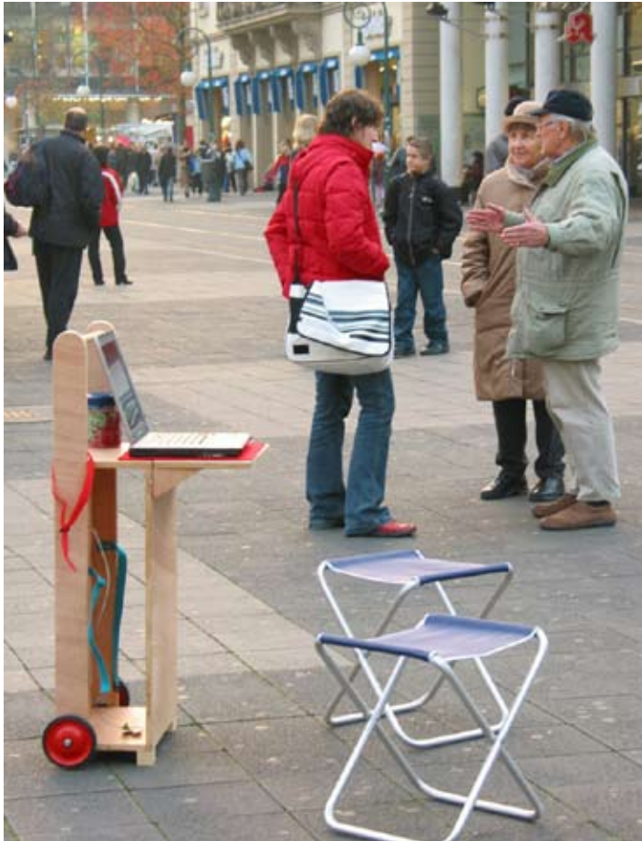
Unterwegs in der Kasseler Innenstadt, November 2004

Um über das Projekt zu informieren und vor Ort - Stadtzentren, Bahnhöfe etc. - Daten für die Datenbank zu sammeln wurde ein mobiles Info-Modul entwickelt. Dies besteht aus einem leicht transportierbaren Möbel mit ausklappbarer Tischfläche und zwei Klapphockern. Ein Laptop bietet die Möglichkeit, die Info-Website und Datenbank auf der lokalen Festplatte anzusehen und zu benutzen.